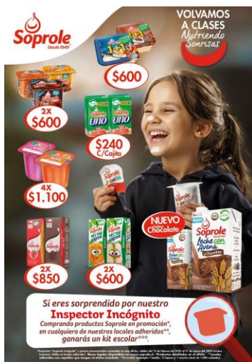
Imagen referencial del afiche:

En virtud de esta Promoción, los consumidores que compren en los Locales Adheridos podrán adquirir cada unidad de los siguientes productos a un precio promocional según lo establecido en la tabla inserta a continuación: